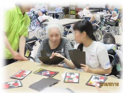
学生さんとの交流会