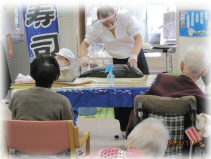
ブリの解体ショー