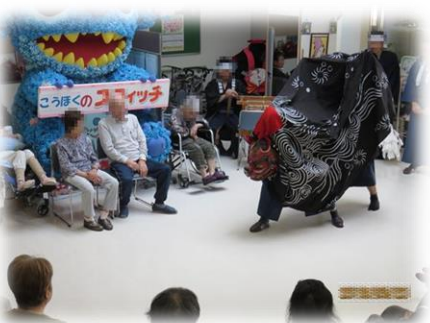
地域の方との交流会